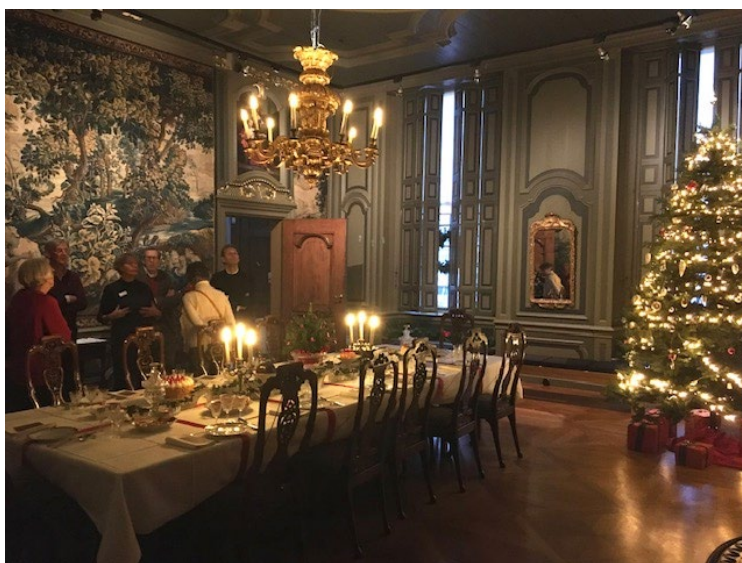
Vrijwilligersmiddag op 5 januari 2023

De jaarlijkse vrijwilligersborrel vond plaats op 5 januari 2023 in het Huis van Gijn. Alle vrijwilligers die zitting hebben in een commissie waren uitgenodigd. De middag bestond uit een rondleiding in het museum, dat geheel in kerstsfeer was omgetoverd. De middag werd afgesloten met een borrel.