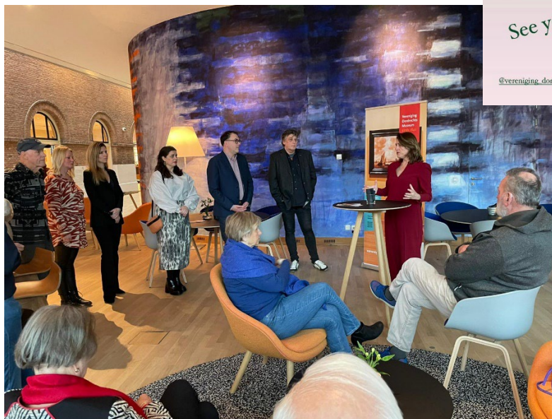
Kunstzin! 30 april 2023