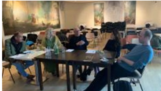
De jury in conclaaf op 3 november 2023