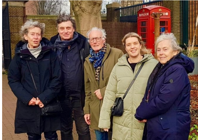
Commissie Public Relations