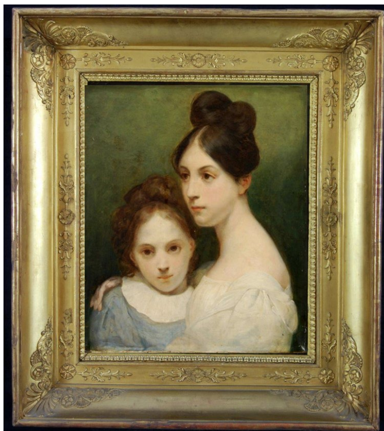
'Mesdemoiselles de la Fayette' door Ary Scheffer (VDM-collectie)