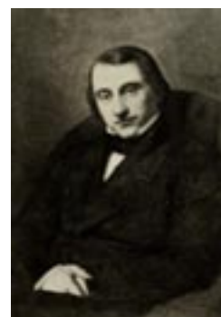
Zygmunt Krasinski (1812-1859), geschilderd door Ary Scheffer. Deze rondreizende Poolse dichter was een romantische ziel met wie Ary tijdens zijn bezoek aan Dordrecht innig bevriend raakte. Ary voelde zich begrepen en getroost door deze man, die net als hij veel geleden had. Later ontving hij hem in Parijs.

Als rooms-katholiek priester kwam hij in conflict met de kerk over zijn liberale gedachten, maar hij weigerde zich te schikken en moest in ongewijde grond begraven worden (op Père Lachaise).