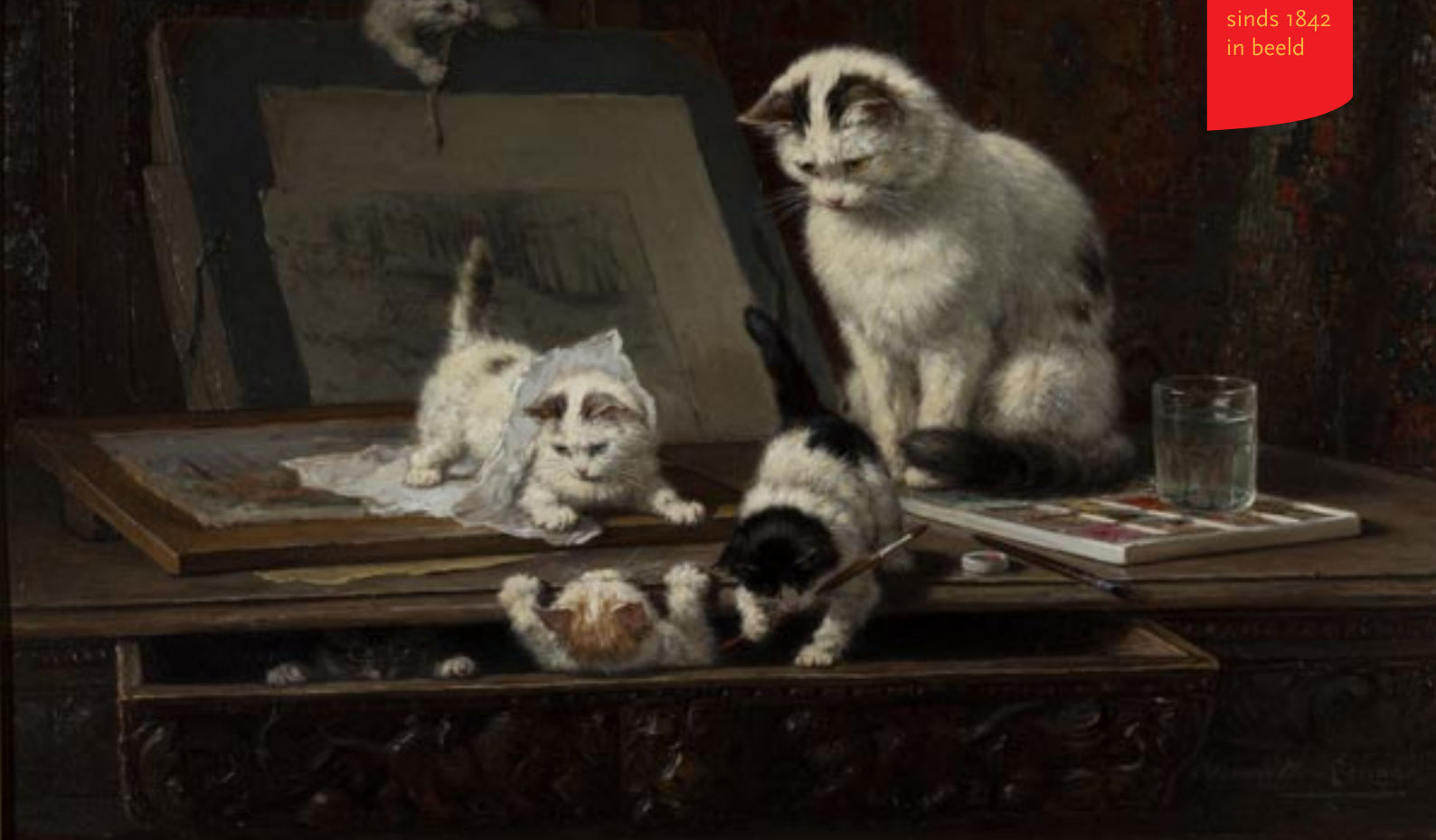
De teekenaars geschilderd door Henriëtte Ronner-Knip