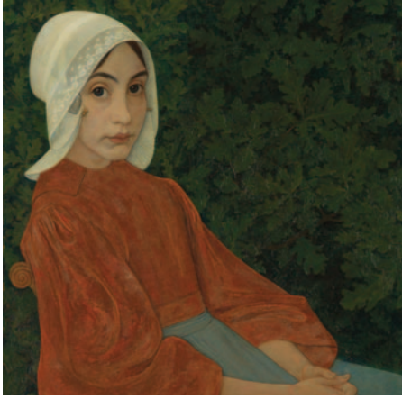
Jan Veth, Karen, 1892, Kröller-Müller Museum