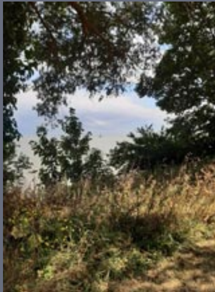
IJsselmeer bij Enkhuizen.