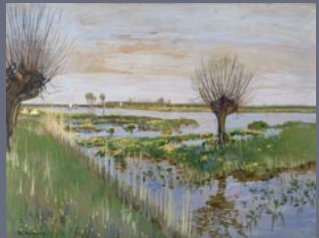
Reinier Kennedy - Dotterveld