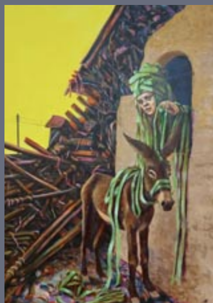
Amrad Hashem Relay-2021-