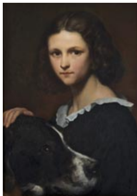
Ary Scheffer - Cornelia met haar hond Turc (1840)

lie het verhaal dat zij een model uit het atelier zou zijn geweest.