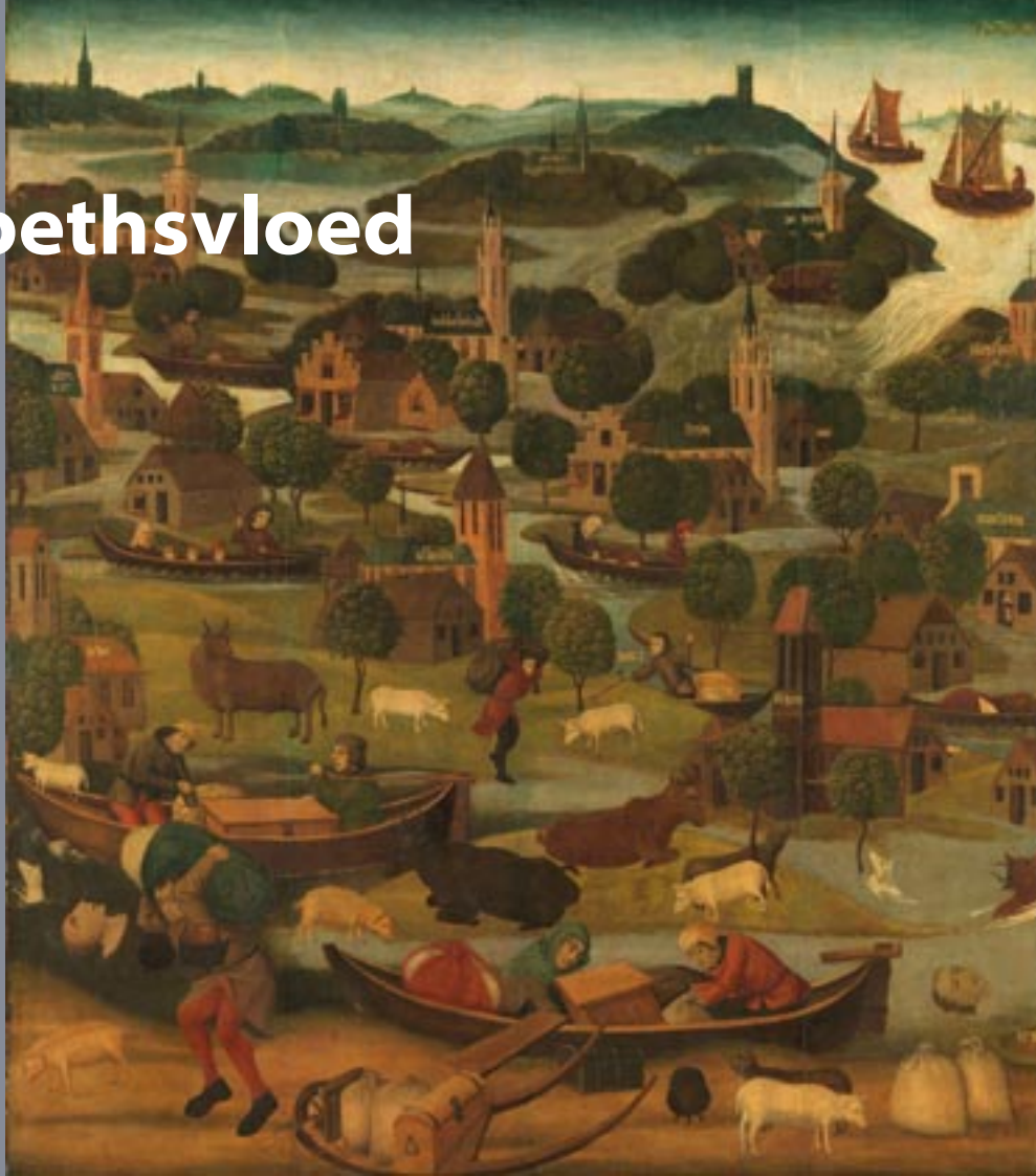
De Sint-Elizabethsvloed, Meester van de Heilige Elisabeth-Panelen, ca. 1490 - ca. 1495 - Rijksmuseum

Geheel in lijn met de huidige actualiteit besteedt de tentoonstelling ruim aandacht aan het uiteenrafelen van feit en