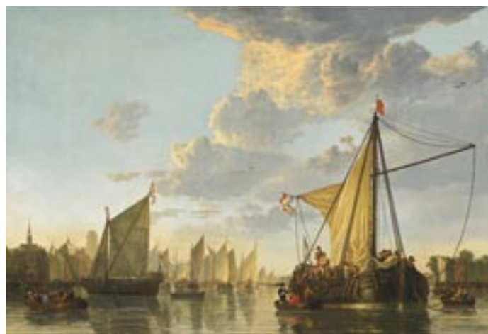
Aelbert Cuyp -De Maas bij Dordrecht ca 1650