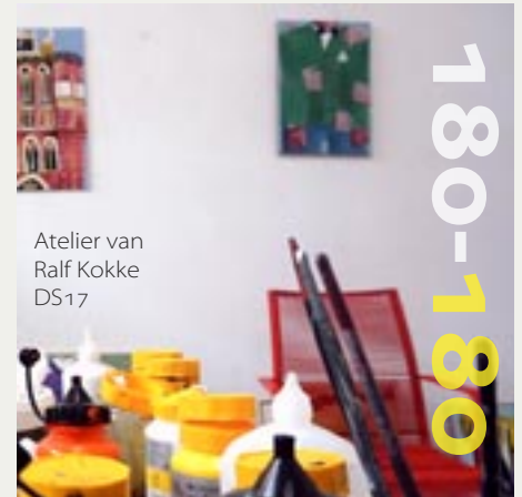
Atelier van Ralf Kokke DS17

Achteraf een drankje bij Art & Dining. Aanmelden en betalen via de VDM website o.v.v. 'de Scheffer'.