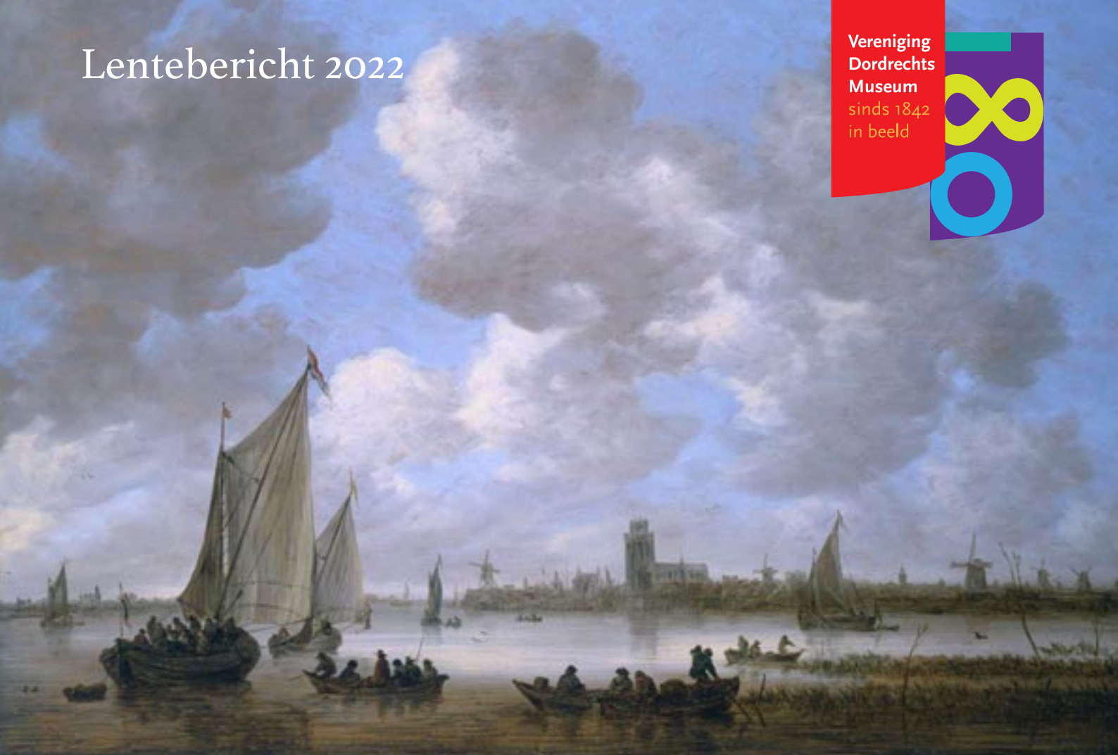
Jan van Goyen, Gezicht op de Oude Maas bij Dordrecht, 1651, Dordrechts Museum

Aankoop met steun van : Vereniging Rembrandt, Mondriaan Fonds, Bedrijfsvrienden Dordrechts Museum, vele andere fondsen, bedrijven en particulieren, 2008