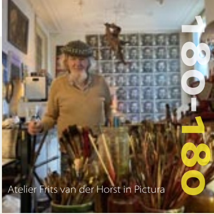
Atelier Frits van der Horst in Pictura