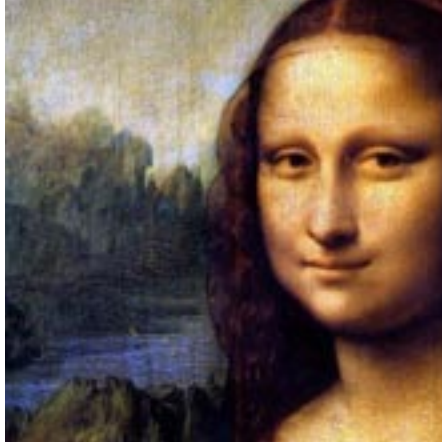
Leonardo Da Vinci, Mona Lisa / Het Louvre in Parijs

Alle VDM activiteiten worden uiteraard aangepast aan de dan geldende corona regels, dus houdt onze website in de gaten voor aanpassingen.