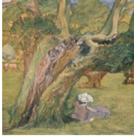
Jan Toorop - Oude Eik in Surrey