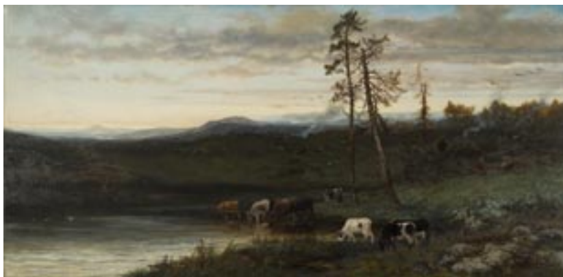
Alexander Wüst – Bergachtig landschap, 1871