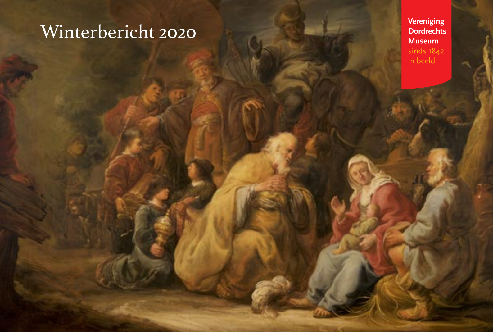
Benjamin Gerritsz Cuyp - De aanbidding van de Koningen, 1640