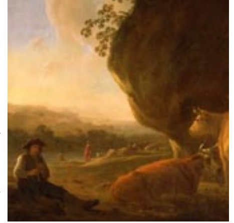
Aelbert Cuyp-landschap met fluitspelende herder en vee