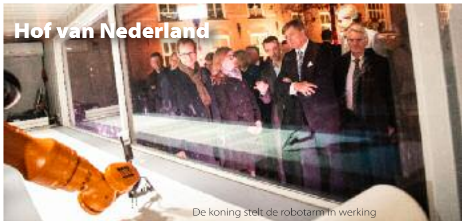
De koning stelt de robotarm in werking