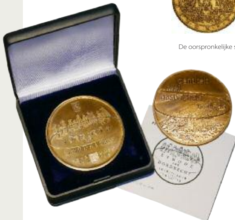
De synode penning 2018 van Theun Okkerse.