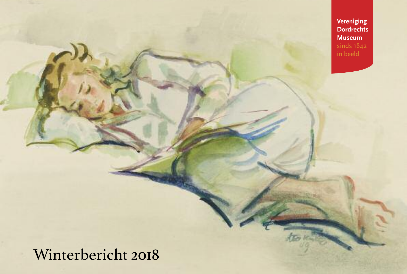
Otto Dicke, Elsje , aquarel, 1949