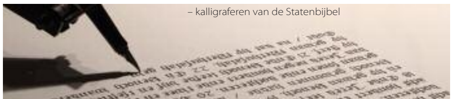
- kalligraferen van de Statenbijbel