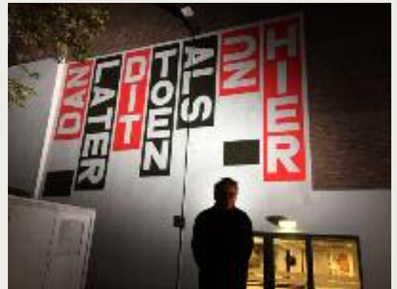
De muurschildering van Kraayeveld op het Energiehuis.

Op 16 november werd de eerste muurschildering van Ton Kraayeveld onthuld op het Energiehuis, de komende maanden ziet u schilderijen