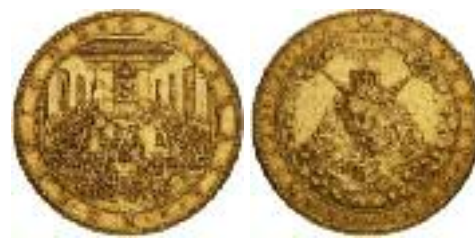
De oorspronkelijke synodepenning van Bylaer.

De penning is 45 mm. in diameter en de voorlopige oplage betreft 500 stuks in brons, 25 in zilver en 3 in goud. De penning is te koop in het Dordrechts Museum, de Grote Kerk en bij de VVV.