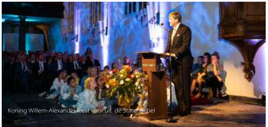
Koning Willem-Alexander leest voor uit de Statenbijbel

Projectie op de gevel van de Augustijnenkerk