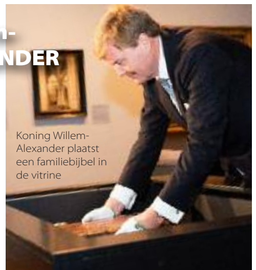
Koning Willem-Alexander plaatst een familiebijbel in de vitrine