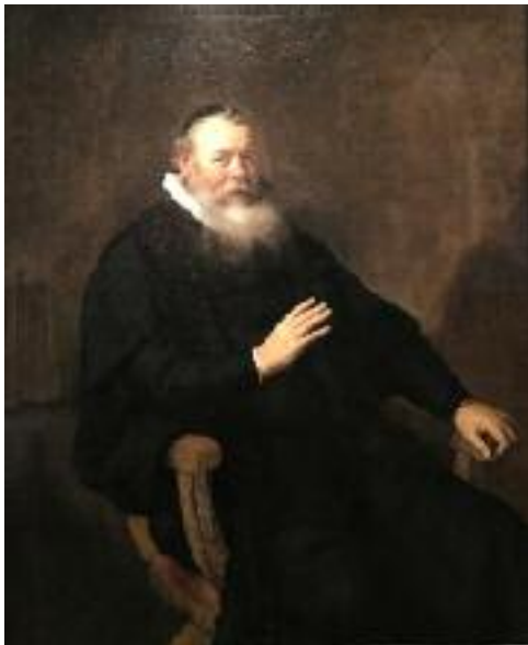
Rembrandt van Rijn, Eleazar Swalmius , 1637. Koninklijk Museum voor Schone Kunsten, Antwerpen.

D e tentoonstelling Bid, werk en bewonder is nog maar net begonnen en bevat heel wat werken die voor wat extra aandacht in deze rubriek in aanmerking zouden komen. Met dit portret van de contra-remonstrantse predikant Eleazar Swalmius hebben we wel weer een heel bijzondere parel in huis: een Rembrandt in rustige tinten, mooi uitgelicht, van een vriendelijke man. Toch hoorde hij bij de strenge richting die zich tijdens de Dordtse Synode verzette tegen de Remonstranten. Waarschijnlijk komt dat door zijn achtergrond als zoon van een Vlaamse vluchteling, die net als vele andere calvinisten om het geloof naar Engeland was uitgeweken voor de vervolgingen onder Alva. Liever kiezen voor een leven als vluchteling dan iets afdoen aan je principes – het zijn niet de meegaande types die zo’n route kiezen. Deze vader werd in 1580 predikant in Rhooen, dat bij de classis van Dordrecht hoorde. Eleazar was