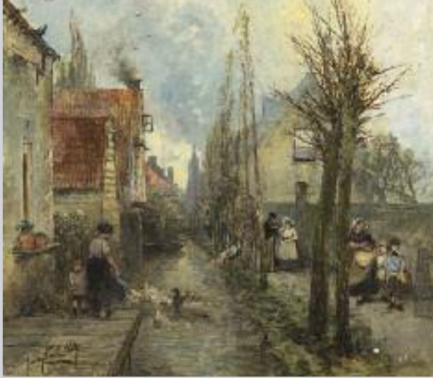
Johan Barthold Jongkind, Gracht in Delft, 1859, particuliere collectie

Dit jaar willen we in elk kwartaalbericht uit een lopende tentoonstelling één schilderij in het bijzonder aandacht geven. Deze keer is dat Gracht in Delft, een tafereeltje uit het dagelijks leven in het midden van de 19e eeuw. We zien een idyllisch tafereeltje, misschien is het voorjaar, dat zit in elk geval in de lucht. De bomen zijn nog bijna helemaal kaal, maar het groen lijkt al door te komen. De vogels vliegen af en aan, de zon doet zijn best door de wolken te breken en er is blauw in de lucht. De kachel brandt nog, maar de vrouwen stappen al met blote armen de deur uit. De een om even haar schort uit te schudden voor de eenden, anderen om een praatje te maken, een boodschap te doen, de was uit te spoelen, water met een emmer op te halen of afvalwater weg te gooien in de gracht. Het water is overal dichtbij in de Hollandse steden, een steigertje aan de ene kant, een smal, zo te zien modderig pad aan de andere. Zo moet Dordrecht er ook uitgezien hebben, bijvoorbeeld op de Lindengracht die nu Museumstraat heet.