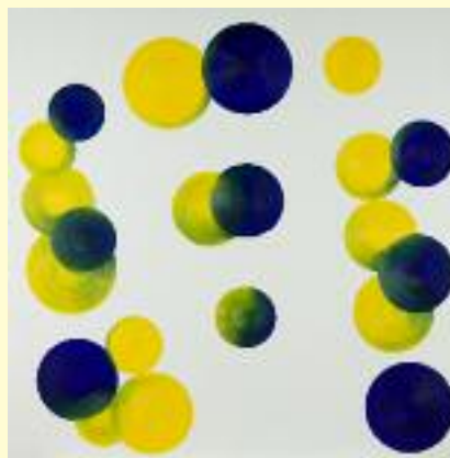
Johan van Oord – Compositie 19a.4 (2017)