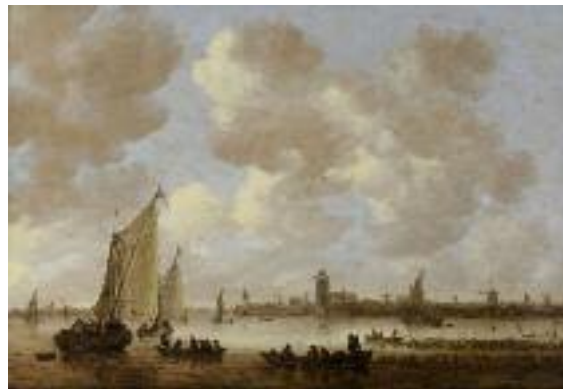
Jan van Goyen Gezicht op de Oude Maas bij Dordrecht 1651 DM/008/886, olieverf op paneel, 67,2 x 97,7 cm

verzamelingen 19de eeuwse kunst. Niet alleen particulieren schonken in geld en in natura, maar ook kunstenaars wilden vertegenwoordigd zijn in dit Dordtse museum, zoals blijkt uit de 'Schenking Ary Scheffer'. Ook oude kunst van kunstenaars uit Dordrecht (Bol en Van Hoogstraten, en De Gelder: