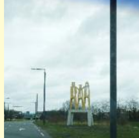
Cor van Gulik – De legende van de schapenkoppen

zien en te genieten ook zonder deze klauterpartij, maar het zou kunnen. Tijdens het afsluitende drankje in een andere ‘echte’ Hilversumse locatie kunnen wij napraten over hetgeen we gezien hebben.