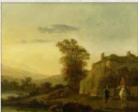
De terugkeer van de schilderijen in 1945. Te zien is niet alleen de Vismarkt van Jacob Cuyp, maar ook het schilderij van Abraham van Calraet, landschap met ruiter bij avondlicht