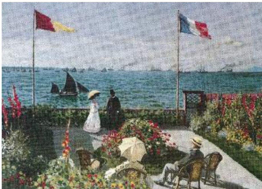
Claude Monet, Sainte Adresse Le Havre