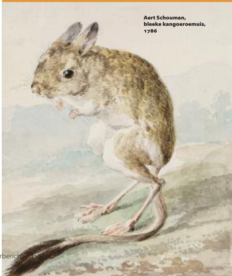
Aert Schouman, bleeke kangoeroemuus, 1786

Wilt u nu reeds meer informatie dan kunt u terecht bij Jos Faaij (06 18 26 59 05) en Lia van de Kerkhof (06 22 47 10 46).