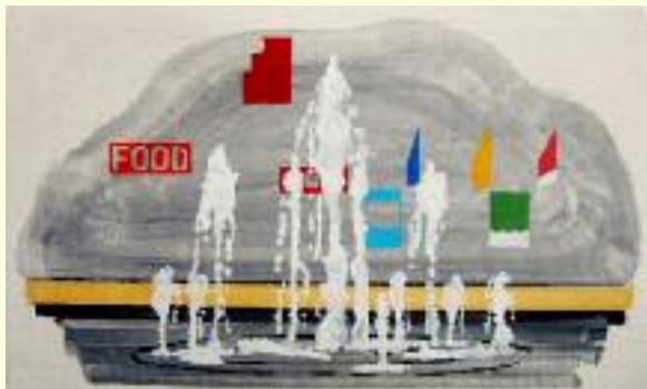
Ton Kraayeveld Fountain (Statenplein)

Kraayeveld gaat zich bezighouden met het thema "de stad en de mens". Hiervoor zal hij gedurende 2017 een tekeningenserie maken op klein formaat. Een aantal daarvan wordt ook groter uitgewerkt. Het werk zal geregeld op verschillende manieren met de stad en zijn inwoners worden gedeeld. Het werk van Ton Kraayeveld (1955) is bijna grafisch en raakt opvallend aan de huidige tijdsgeest. Hij geeft zijn beeldende ideeën -die niet direct maatschappelijk geëngageerd zijn- op zo'n manier weer dat er zich een zekere dubbelzinnigheid voordoet.