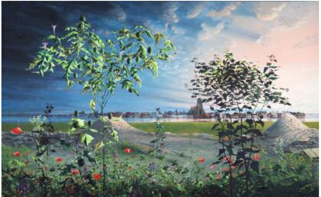
Olphaert den Otter, Dordrecht Becalmed , 2014